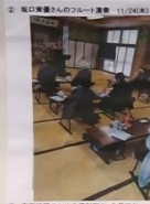
① 安全確認のための資料配布 7月下旬